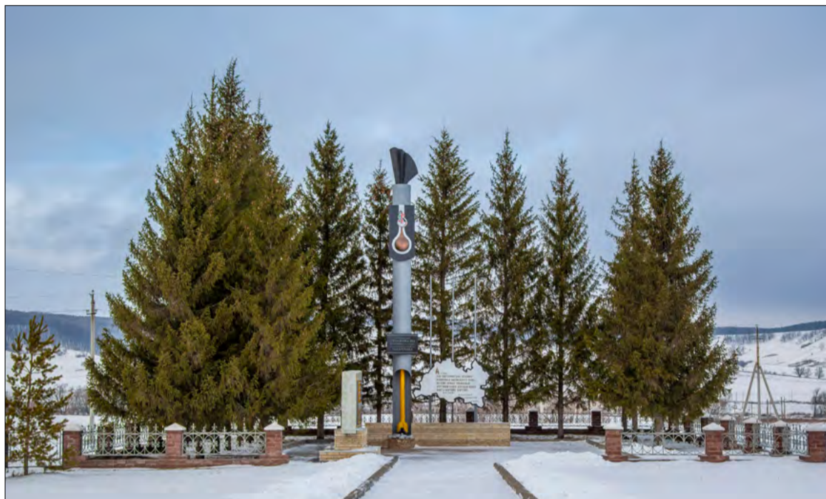
Увековечивший подвиг первопроходцев обелиск в д. Новое Шугурово